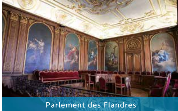
Parlement des Flandres